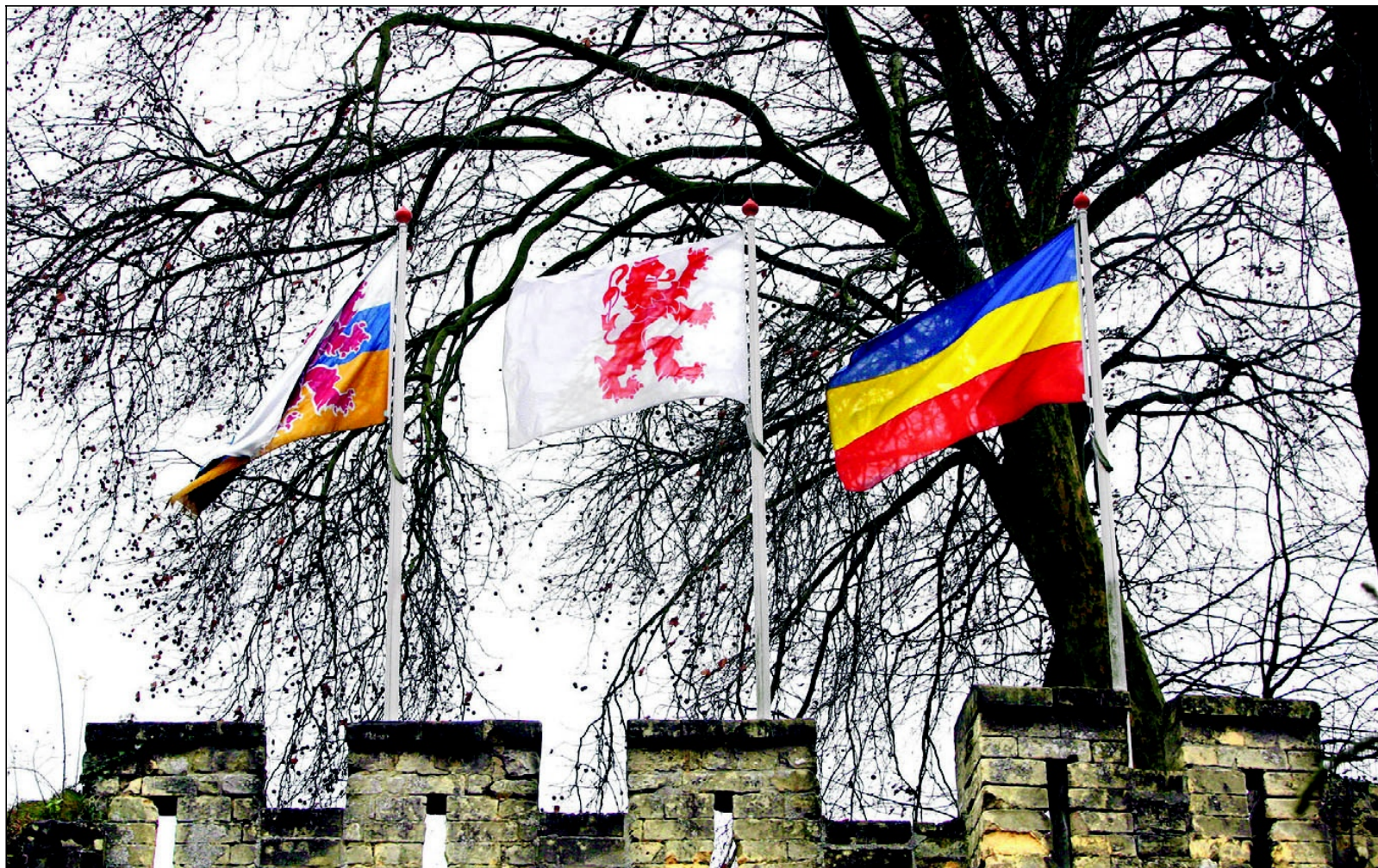
De rode leeuw van de heren van Valkenburg op de kasteelruïne.